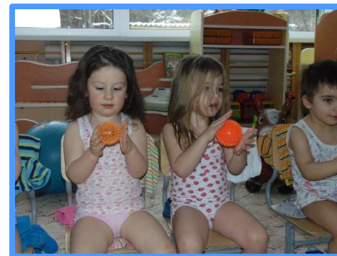
Система закаливающих мероприятий