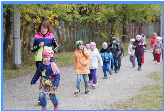
Занятия по физическому развитию