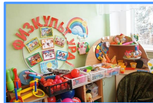
«Спортивные центры» в группах